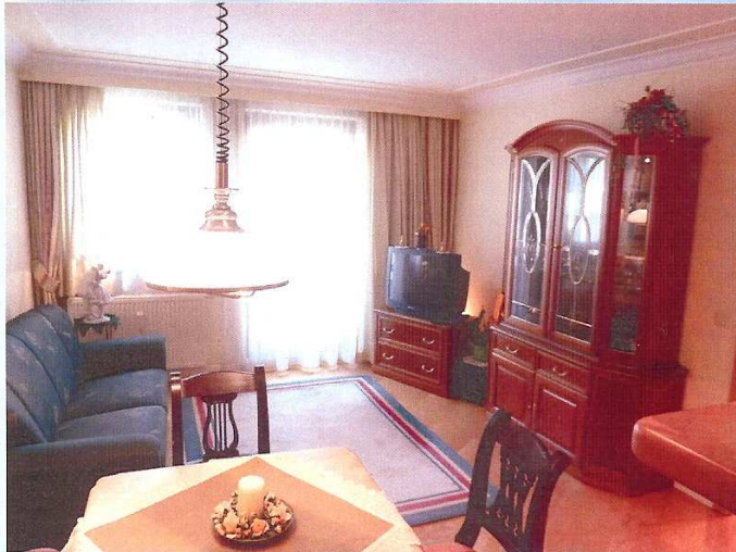
Wohnzimmer mit Essecke